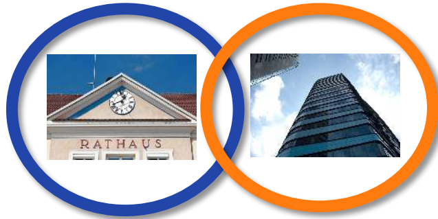
Führen als Hero